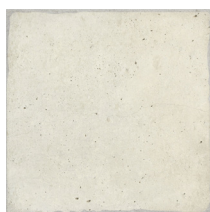
01 | Base White