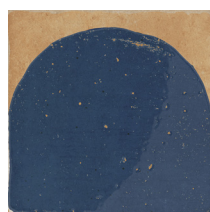
07 | Decor Blue