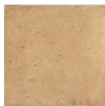
03 | Base Terracota