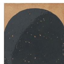
08 | Decor Black