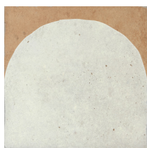
02 | Decor White