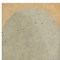
05 | Decor Khaki Green