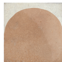
04 | Decor Cotto